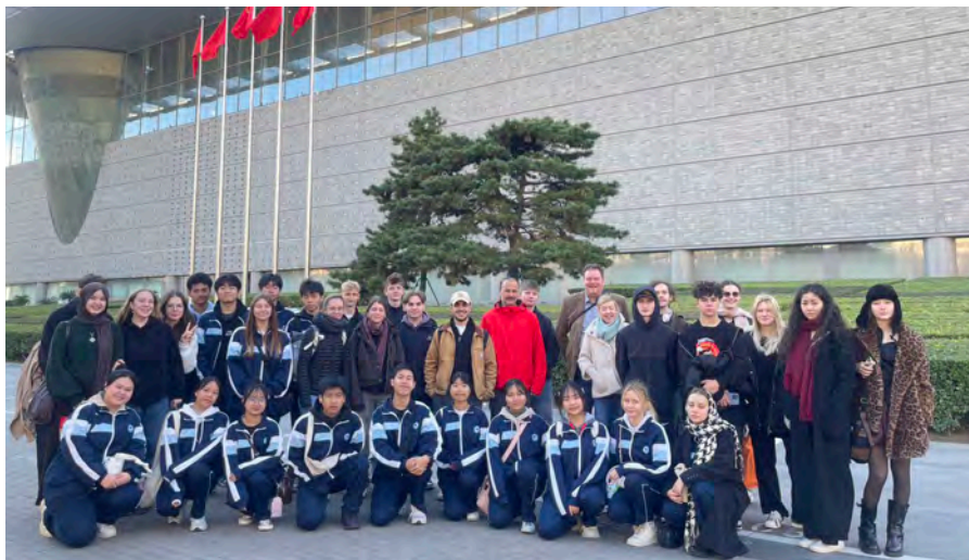
Schüleraustausch mit unserer Partnerschule in Peking