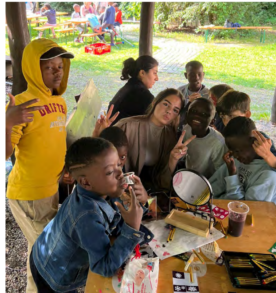
Die Kaufleute für Büromanagement veranstalteten u.a. ein Sommerfest im Friedensdorf Oberhausen

nisse zustande. Gruppe 1 produzierte mit Unterstützung durch die Jugendredaktion Salon 5 den Podcast „Geschnitten Brot“. In sechs Folgen setzen sie sich intensiv mit dem Thema Gewalt an Kindern auseinander. Gruppe 2 hat ein Kinderbuch zum Thema Inklusion geschrieben und illustriert, das dank Unterstützung der Stadt Bottrop, dem Bildungsbüro und der Ernst-Löchelt-Stiftung für alle Bottroper 3.- und 4.-Klässler gedruckt wird. Mit Hilfe von Sponsoren wird sogar noch ein wie im Buch thematisiertes inklusives Spielgerät angeschafft. Gruppe 3 veranstaltete ein Sommerfest im Friedensdorf Oberhausen und bereitete den Kindern dort, die allesamt aus Krisengebieten stammen, einen unvergesslichen Tag mit Aktionen wie Kinderschminken, Armbänder basteln und Fußball spielen. Das dafür notwendige Budget hatten sie zuvor durch Waffelverkauf und eigene Spenden zusammengetragen.