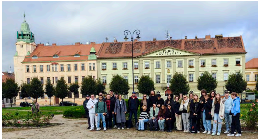
Gedenkstättenfahrt nach Tschechien mit dem SoR-SmC Team