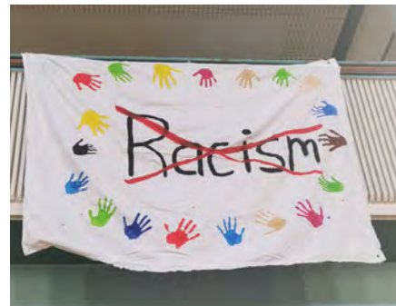
Ein Zeichen setzen im Lichthof

Unsere Schülervertretung zeigte sich meinungsstark und couragiert, als sie sich mit mehreren Aktionen gegen die Durchführung eines Bürgerdialogs der AfD im Lichthof des Berufskollegs positionierte: In einem offenen Brief an die Stadt kritisierten sie sachlich und fundiert, dass eine vom Oberverwaltungsgericht NRW als Verdachtsfall hinsichtlich rechtsextremer Bestrebungen eingestufte Partei eine politische Veranstaltung an einem Ort durchführen darf, an dem a) Jugendliche aus 50 Nationen unterrichtet werden und b) sogar eine an die Gräueltaten der Bottroper Nationalsozialisten erinnernde Gedenktafel installiert ist. Der Lichthof wurde von SV und dem Team „Schule ohne Rassismus – Schule mit Courage“ (kurz: SoR-SmC) mit demokratiefreundlichen Bannern dekoriert. Zusätzlich hielten die beiden Schülersprecher repräsentativ eine Rede bei einer Gegenveranstaltung des Bündnis Buntrotrop.