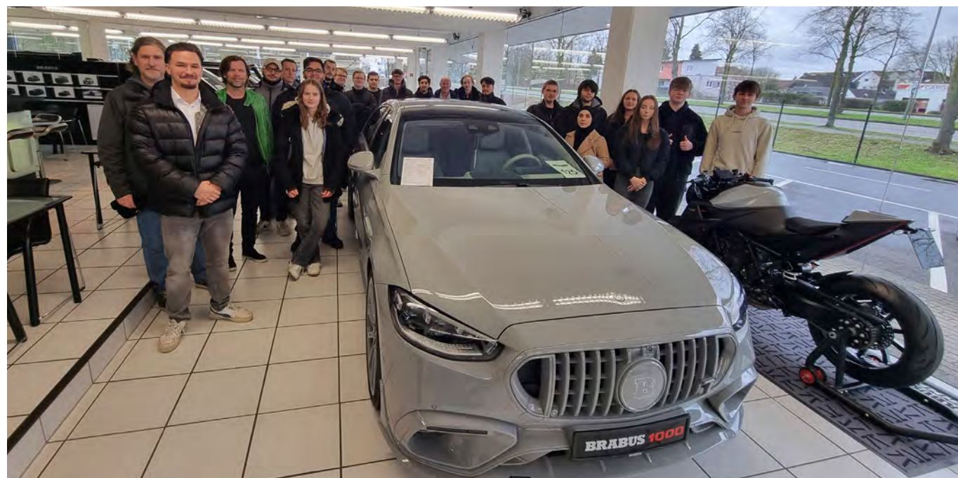
Die Kaufmännischen Assistenten besuchten das „Luxury-Mobility“-Unternehmen Brabus